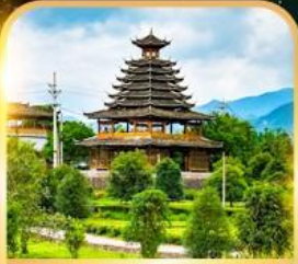
หมู่บ้านชนเผ่าตัง