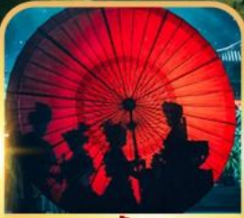
ชมแสงสีท่าเกิงหลง