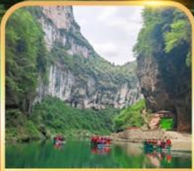
อุทยานจินหลี่ซาน