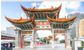
ประตูม้าทองไถ่หยก