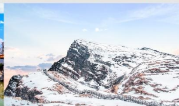
ภูเขาหิมะเจี้ยวจื้อ