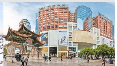
ถนนคนเดินหนานผิงเจีย