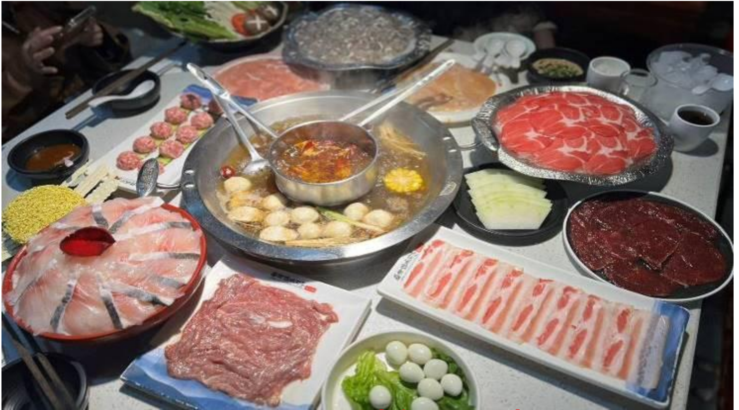
กลางวัน รับประทานอาหารกลางวัน ณ ภัตตาคาร (เมื่อที่ 8) *เมนูพิเศษ สุกี้หมาล่าเสฉวน