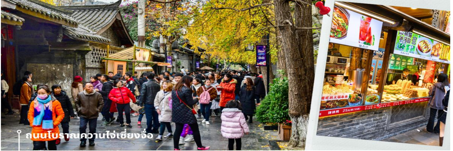
ถนนโบราณความใจ๋เซียงจ้อ

ตั้งเรียงรายอยู่ในแต่ละซอยและตรอกให้เดินช้อปปิ้งเพลิน ทั้งร้านหนังสือ ร้านชา-กาแฟ บาร์ เสื้อผ้า ไปจนถึงร้านอาหารนานาชาติ ให้ท่านได้อิสระเที่ยวตามอัธยาศัย