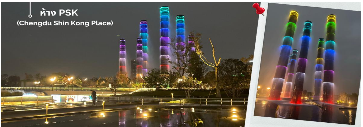
ห้าง PSK (Chengdu Shin Kong Place)

นั้ า ท ่า น เ ตื น ท ่า ง สู่ Global Center แลนด์มาร์คยักษ์ของเมืองเฉิงตูที่ขึ้นชื่อว่าเป็นหนึ่งในอาคารที่มีขนาดใหญ่ที่สุดในโลก ภายใน ศูนย์การค้าแห่งนี้ครบครันทั้งช้อปปิ้งแบรนด์ดัง โรงแรม ศูนย์ประชุม โรงภาพยนตร์ อีกหนึ่งจุดไฮไลต์ที่ไม่ควรพลาดเมื่อมาเยือนศูนย์การค้า Global Center คือ น้ำพุไม้ไฟ การออกแบบสุดสร้างสรรค์ที่ผสมผสานความงดงามของธรรมชาติกับศิลปะสมัยใหม่ น้ำพุแห่งนี้สร้างขึ้นในรูปทรง “กอไฟ” อันเป็นสัญลักษณ์ของความสงบและความ รุ่งเรืองของชาวเสฉวน เมื่อเปิดการแสดง น้ำจะพุ่งขึ้นสู่ท้องฟ้าพร้อมแสงไฟหลากสี สร้างบรรยากาศตระการตาและโรแมนติก