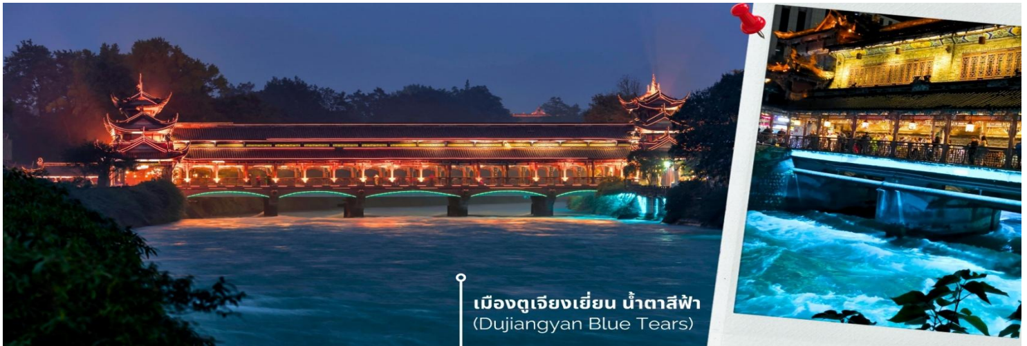
เมืองดูเจียงเยียน น้ำตาสีฟ้า (Duijiangyan Blue Tears)

กลายเป็นภาพอันน่าประทับใจยามค่ำคืนเมื่อแสงไฟตกแต่งส่องสะท้อนน้ำให้กลายเป็น นสีฟ้าเงิน ดูสวยงามราวกับโลกแห่งจินตนาการ