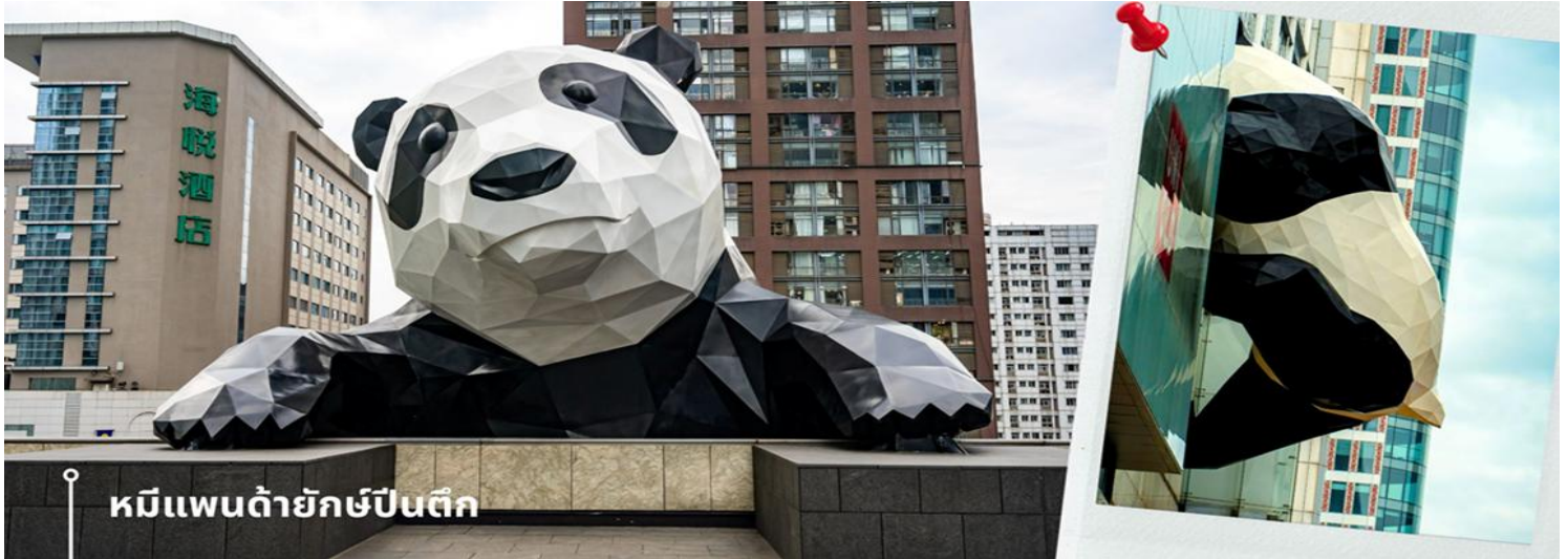
หมีแพนด้ายักษ์ปักกิ่ง

สินค้าบางรุ่นมีความหายากและคอลเลกชันพิเศษ เช่น สาย Apple Watch ลานบู กระเป๋าผ้าลานบูและ Flying Disc ที่อาจไม่มีวางจำหน่ายในไทย