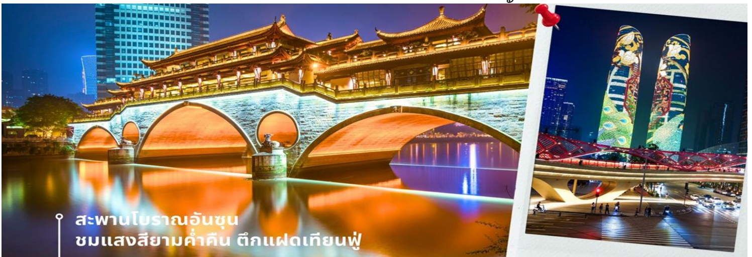
สะพานโบราณอันชุน ชมแสงสียามค่ำคืน ตึกแฝดเทียนฟู

นำท่านชม สะพานโบราณอันชุน-พร้อมชมแสงสียามค่ำคืน ตึกแฝดเทียนฟู เป็นสะพานข้ามคลองที่สร้างเป็นเหมือนอาคารอยู่ข้างบน ในช่วงเวลายามเย็นจะเป็นช่วงที่ผู้คนออกมาชมบรรยากาศบริเวณของสะพานแห่งนี้ และมีร้านค้ามากมาย รวมไปถึงบาร์เครื่องดื่มต่างๆ ที่ดึงดูดนักท่องเที่ยวได้เป็นอย่างดี เป็นสะพานที่ทอดข้ามแม่น้ำจินเจียง และเป็นรูปแบบสะพานมีหลังคา ตามลักษณะสถาปัตยกรรมจีนโบราณ อายุมากกว่า 300 ปี และในบริเวณใกล้เคียงกัน ยังเป็นที่ตั้งของ ตึกแฝดเทียนฟู โดยในช่วงค่ำเวลาประมาณ 19.00-22.00 น. ทั้ง 2 ตึกจะเป็นไฟ LED สวยงามโดดเด่นมาก ตึกแฝดเทียนฟู หรือที่เรียกอย่างเป็นทางการว่าตึกศูนย์การเงินนานาชาติเทียนฟู เป็นตึกระฟ้าที่สวยงามโดดเด่นสองตึกในย่านการเงินของเมือง ตึกแต่ละตึกมีความสูง 58 ชั้น และสูงกว่า 700 ฟุต ตึกเหล่านี้โดดเด่นเป็นพิเศษด้วยภายนอกที่หุ้มด้วยไฟ LED ที่เป็นเอกลักษณ์ ซึ่งเปลี่ยนอาคารให้กลายเป็นจอภาพดิจิทัลขนาดใหญ่