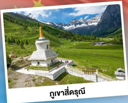
กู๋เจาสื่อตรุณี

เที่ยว 2 อุทยาน กู๋เจาสื่อตรุณี & ปี้เฉิงโกว เดินชมหมีแพนด้าสุดน่ารัก ใกล้ชิดกับแพนด้าแดง