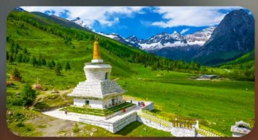
กุเวาสีดรุณี