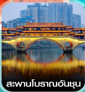
สะพานโบราณอันชุน