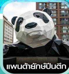
แพนด้ายักษ์ป็นตึก

คอนเฟิร์มออกเดินทาง ทุกพีเรียด 2 ท่านขึ้นไป