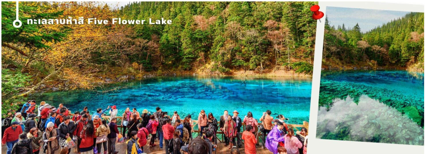
ทะเลสาบห้าสี Five Flower Lake

ทะเลสาบที่ใหญ่ที่สุด สูงที่สุด และลึกที่สุดในจังหวัดจิวจายโกว ด้วยเนื้อที่กว่า 581 ไร่ ความยาวกว่า 7 กิโลเมตร และลึกถึง 103 เมตร ทอดตัวโค้งเป็นรูปพระจันทร์เสี้ยว เนื่องจากหิมะบนภูเขาละลายลงมา น้ำในทะเลสาบสีฟ้าสวยงาม ล้อมรอบด้วยยอดเขาสูงชัน และต้นไม้เขียวใหญ่ที่ปกคลุมด้วยหิมะ งดงามราวหลุดออกมาจากภาพวาด ความพิเศษในช่วงฤดูหนาว ทะเลสาบจะกลายเป็นน้ำแข็งหนากว่า 60 ซม. ทำให้นักท่องเที่ยวนิยมมาเล่นสเก็ตน้ำแข็งกันเป็นจำนวนมาก