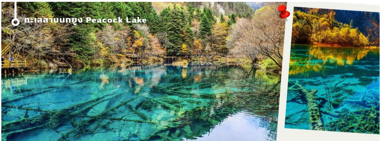
ทะเลสาบนกยูง Peacock Lake

ทะเลสาบมีรูปร่างคล้ายกับนกยูง จึงเป็นที่มาของชื่อ แม้พื้นที่จะไม่กว้างมากนัก มีความยาวเพียงแค่ 310 เมตร แต่ความสวยงามของที่นี่ก็ไม่แพ้จุดอื่นๆ ของอุทยานฯ เพราะน้ำในทะเลสาบเป็นสีฟ้าใสราวกับคริสตัล ไล่เฉดฟ้าอ่อนฟ้าอมเขียว และน้ำเงินตามความตื้นลึกของน้ำ ในช่วงฤดูหนาวต้นไม้จะถูกปกคลุมไปด้วยหิมะสีขาวนวล ดูแล้วคล้ายนกยูงกำลังจำศีล หากมาในช่วงที่มีแสงแดดจะมองเห็นความงดงามได้ทั่วบริเวณ