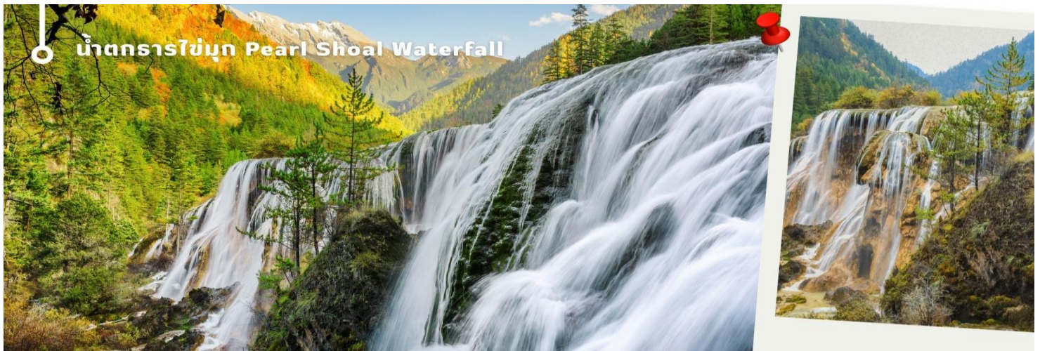
น้ำตกธารไข่มุก Pearl Shoal Waterfall

3. น้ำตกธารไข่มุก (Pearl Shoal Waterfall) หรือ น้ำตกนุริหรือหลง (Nuo Ri Lang Waterfall) ถือเป็นน้ำตกที่ใหญ่ที่สุดในจิวจ้ายโกว มีความสูง 40 เมตร กว้าง 310 เมตร เกิดจากหินปูนที่แข็งตัวจนกลายเป็นรูปทรงคล้ายพัด มีสายธารน้อยใหญ่ไหลผ่านลวดหลั่นทอดยาวผ่านชั้นหินต่างๆ ยามมีแสงแดดสาดส่องตกลงกระทบผืนน้ำจะส่องประกายราวกับเส้นไข่มุกเหมือนชื่อน้ำตก บางครั้งอาจได้เห็นสายรุ้งจากแสงแดดที่สะท้อนกับละอองน้ำอีกด้วย หากได้มาในช่วงฤดูหนาว ก็จะได้เห็นหิมะเกาะตามต้นไม้ โขดหิน และถ้าอากาศหนาวมากๆ น้ำที่น้ำตกก็จะกลายเป็นน้ำแข็ง กลายเป็นประติมากรรมจากธรรมชาติที่สวยงาม