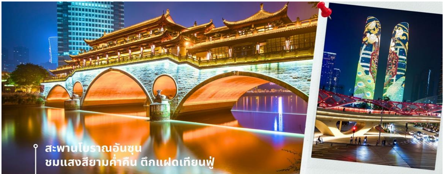
📍 สะพานโบราณอันชุน ชมแสงสียามค่ำคืน ตึกแฝดเทียนฟู

นำท่านชม สะพานโบราณอันชุน-พร้อมชมแสงสียามค่ำคืน ตึกแฝดเทียนฟู เป็นสะพานข้ามคลองที่สร้างเป็นเหมือนอาคารอยู่ข้างบน ในช่วงเวลายามเย็นจะเป็นช่วงที่ผู้คนออกมาชมบรรยากาศบริเวณของสะพานแห่งนี้ และมีร้านค้ามากมาย รวมไปถึงบาร์เครื่องดื่มต่างๆ ที่ดึงดูดนักท่องเที่ยวได้เป็นอย่างดี เป็นสะพานที่ทอดข้ามแม่น้ำจินเจียง และเป็นรูปแบบสะพานมีหลังคา ตามลักษณะสถาปัตยกรรมจีนโบราณ อายุมากกว่า 300 ปี และในบริเวณใกล้เคียงยังเป็นที่ตั้งของ ตึกแฝดเทียนฟู โดยในช่วงค่ำเวลา ประมาณ 19.00-22.00 น. ทั้ง 2 ตึกจะเป็นไฟ LED สวยงามโดดเด่นมาก ตึกแฝดเทียนฟู หรือที่เรียกอย่างเป็นทางการว่าตึกศูนย์การเงินนานาชาติเทียนฟู เป็นตึกระฟ้าที่สวยงามโดดเด่นสองตึกในย่านการเงินของเฉิงตู ตึกแต่ละตึกมีความสูง 58 ชั้นและสูงกว่า 700 ฟุต ตึกเหล่านี้โดดเด่นเป็นพิเศษด้วยภายนอกที่หุ้มด้วยไฟ LED ที่เป็นเอกลักษณ์ ซึ่งเปลี่ยนอาคารให้กลายเป็นจอภาพดิจิทัลขนาดใหญ่