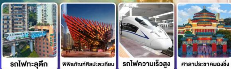
ที่พัก-ลู่ตัก พิพิธภัณฑ์ศิลปะ-ตะเกียบ รถไฟความเร็วสูง ศาลาประชามองชิง