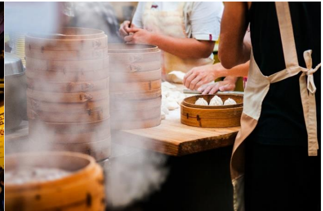
กลางวัน | รับประทานอาหารกลางวัน ณ ภัตตาคาร *** ซิมเมนูเสี่ยวหลงเปา *** ของอร่อยประจำเมือง