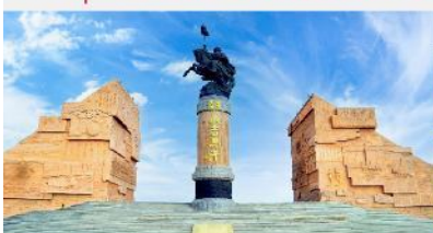
เขตท่องเที่ยวเจงกีสข่าน