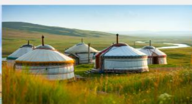
ที่พักแบบกระโจม