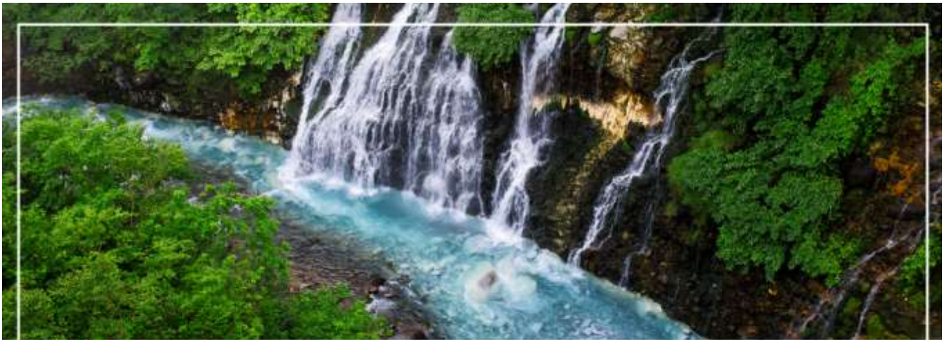
SHIRAHIGE WATERFALL น้ำตกชิราฮิเกะ

วันที่สอง ท่าอากาศยานนิวยอร์กโตเสะ สอกโกโด – เมืองบิเอะ – น้ำตกชิราฮิเกะ – สระอะโออิเคะ หรือ บ่อน้ำสีฟ้า – เมืองอาซาสิดาวา – อีออน อาซาสิดาวา