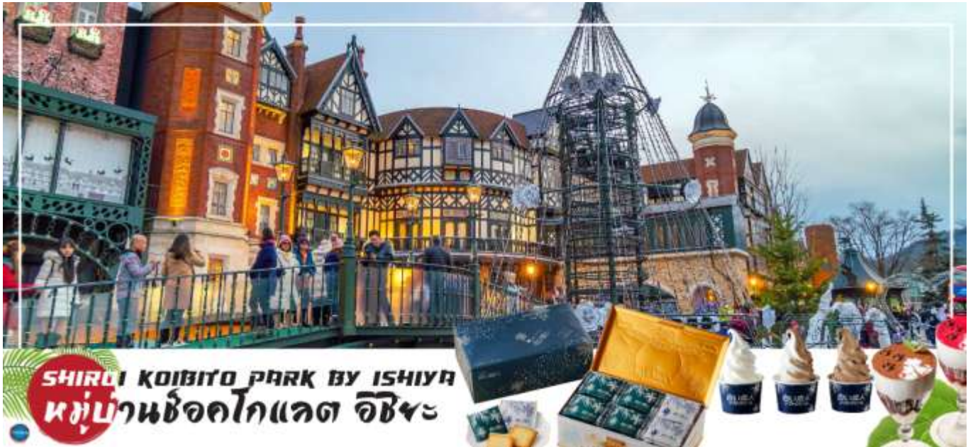
SHIROI KOIBITO PARK BY ISHIYAMA หมู่บ้านช็อคโกแลต อิชิยามะ

ด้วยสวนดอกไม้ จึงทำให้บรรยากาศของหมู่บ้านช็อคโกแลตที่นี่ดูคลาสสิกและน่ารักไปอีกแบบ ช็อคโกแลตที่ขึ้นชื่อที่สุดของที่นี่คือ Shiroi Koibito ซึ่งมีความหมายว่าช็อคโกแลตขาวแต่คนรัก ท่านสามารถเลือกซื้อกลับไปให้คนที่ท่านรักทานหรือว่าซื้อเป็นของฝากติดไม้ติดมือกลับบ้านก็ได้ นอกจากนี้ท่านจะได้เลือกซื้อช็อคโกแลตที่หาซื้อที่ไหนไม่ได้ และ ท่านก็ยังจะได้ชมประวัติศาสตร์ความ