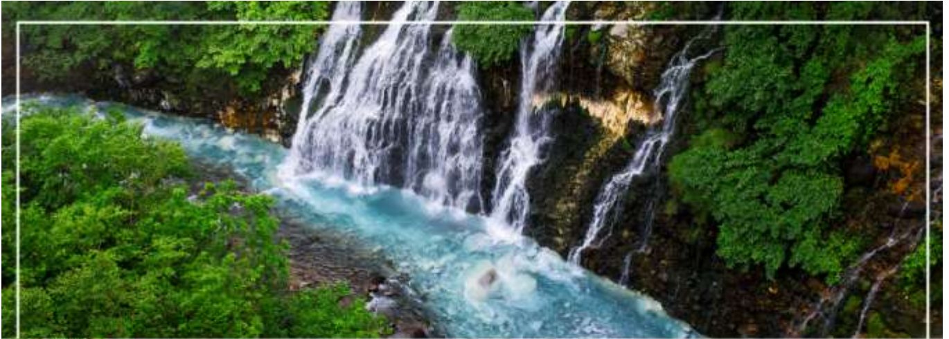
SHIRAHIGE WATERFALL น้ำตกชิราฮิเกะ

วันที่สอง ท่าอากาศยานนิวซีโตเสะ สอกโกโด – เมืองบิเอะ – น้ำตกชิราฮิเกะ – สระอะโออิเคะ หรือ บ่อน้ำสีฟ้า – เมืองอาซาฮิดาว่า – อ็อน อาซาฮิดาว่า