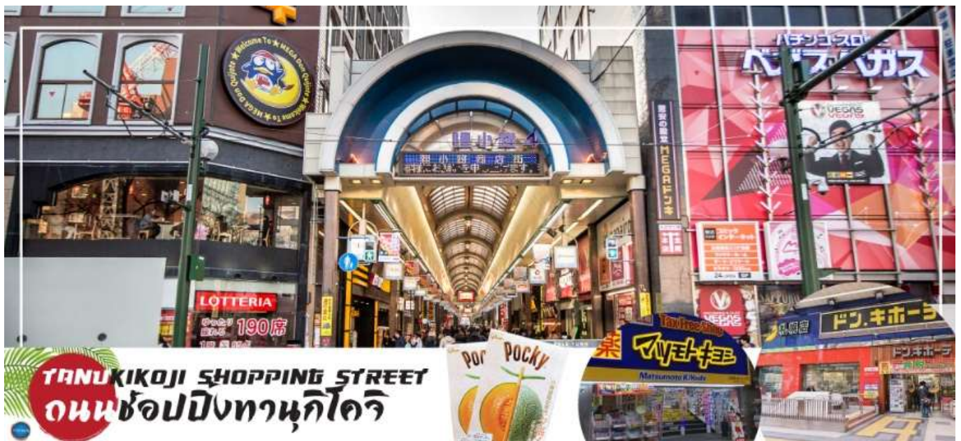
TANUKIKOJI SHOPPING STREET ถนนช้อปปิ้งทานุกิโคจิ