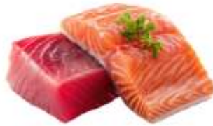
● ไก่ทานปลาดิบ