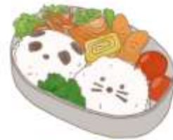
● อาหารสำหรับเด็ก ( 2-11 ปี ) *วัตถุประสงค์ขึ้นอยู่กับทาวราน