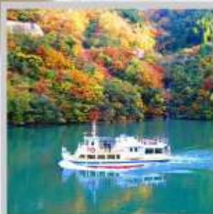
"SHOGAWA YURAN CRUISE"