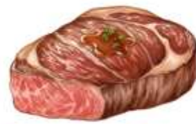
● ไก่ทานเนื้อหมู