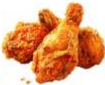
● ไก่ทานสัตว์ปีก (ไก่)