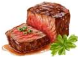
● ไก่ทานเนื้อวัว

ขอความกรุณาแจ้งวัตถุประสงค์ที่ท่าน แพ้หรือไม่สามารถรับประทานได้