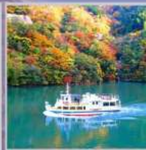
"SHOGAWA YURAN CRUISE"