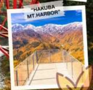
"HAKUBA MT. HARBOR"