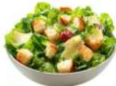
● ผักหรือผลไม้