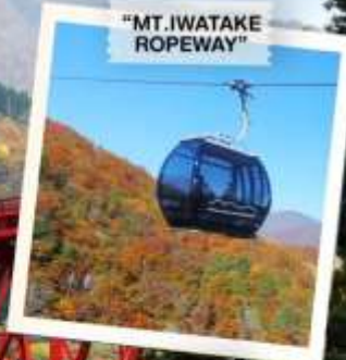
"MT. IWATAKE ROPEWAY"