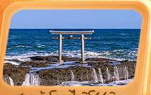
ศาลเจ้าโออาไรโซซึกิ

แะภาพใกล้ชิด "ฟูจิซัง" ที่หมู่บ้านโอชิโนะ ฮักโก สวนโออิชิปาร์ค ที่เกี่ยว Unseen นั่งกระเช้าชมวิวภูเขาสิคุบะ ศาลเจ้าโออาไรโซซึกิ เสาโทริอิริมทะเล อลังการใบไม้เปลี่ยนสี น้ำตกเคงอน ศาลเจ้านิกโกโทโกกุ เสริมมงคล วัดพระใหญ่อุซึคุ โดบุคิสี ห้ามพลาดโคมแดงยักษ์ วัดอาซากุสะ อัมมร่อยตลาดปลาโทโยสุ ทักทายแมว 3D ย่านชิจูกุ ซุปป์ิงจู้ใจย่านดังชิบูย่า