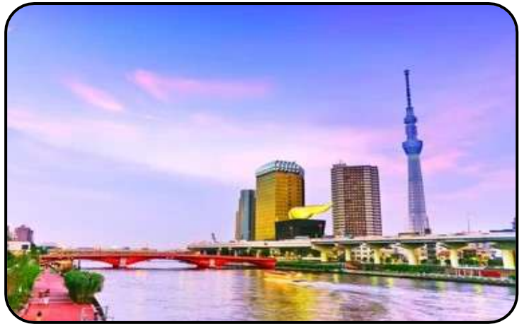
แม่น้ำซูมิตะ

นำท่านเดินทางสู่ วัดอาซากุสะ (Asakusa) วัดที่เก่าแก่ที่สุดในกรุงโตเกียว ขอพรจากเจ้าแม่กวนอิม ทองคำ ท่านยังจะได้เก็บภาพประทับใจกับโคมไฟขนาดยักษ์ที่มีความสูงถึง 4.5 เมตร ซึ่งแขวนอยู่บริเวณประตูทางเข้าวัด และยังสามารถเลือกซื้อเครื่องรางของขลังได้ภายในวัด ฯลฯ หรือเพลิดเพลินกับ ถนนนากามิเสะ ถนน ซ้อปปิงที่มีชื่อเสียงของวัด มีร้านขายของที่ระลึกมากมายไม่ว่าจะเป็นเครื่องรางของขลัง ของเล่นโบราณและตกท้ายด้วยร้านขายขนมที่คนญี่ปุ่นชื่นชอบ แม้กระทั่งองค์จักรพรรดิปัจจุบันยังเคยเสด็จประพาสและเสวยขนมร้านดังนี้อีกด้วย