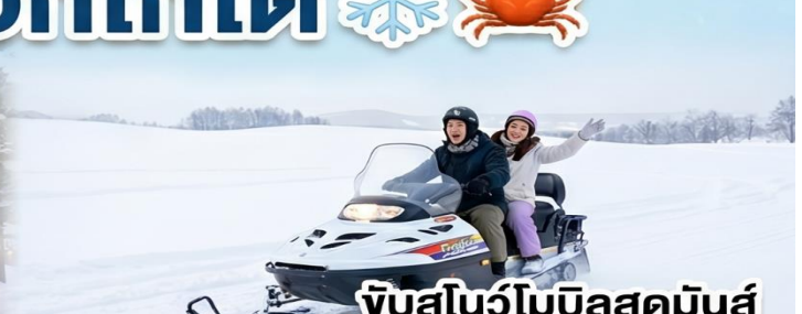
จับสโนว์โมบิลสุดมันส์ Snowland Shikisai No Oka