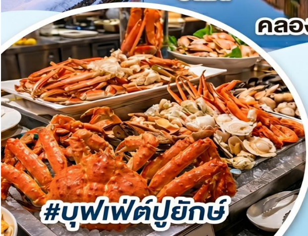
#บุฟเฟ่ต์ปูยักษ์