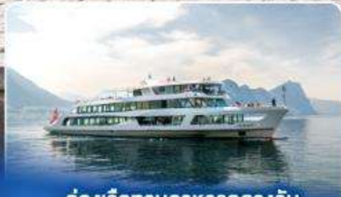
ล่องเรือทานอาหารกลางวัน ทะเลสาบลูเซิร์น