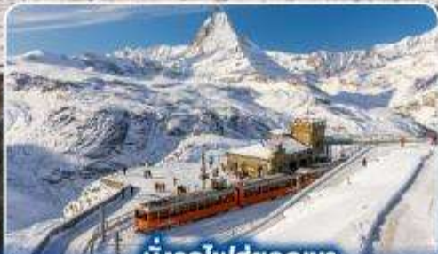
นั่งรถไฟสุดยอดเขา กรอนเนอร์แกรต