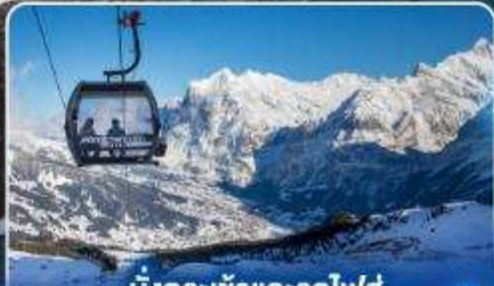
นั่งกระเช้าและรถไฟสุด ยอดเขาจุงเฟรา