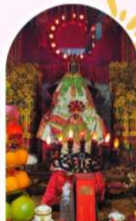
วัดเจ้าแม่กวนอิมอ่องอ่า บอพรเรื่องเงิน ทรัพย์สิน และความมั่งคั่ง