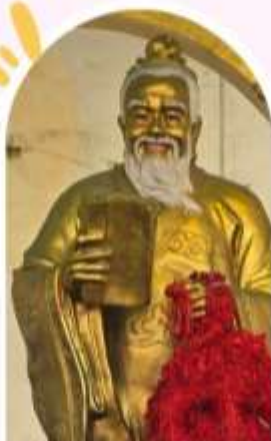
วัดหวังต้าเซียน บอพรสุขภาพ ความรัก