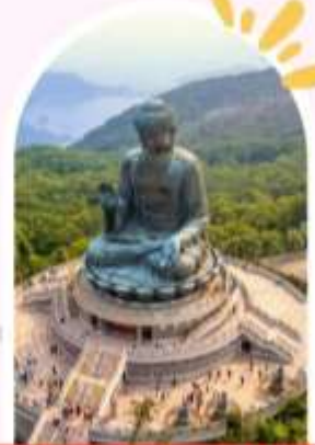
นั่งกระเช้านองปิง นมัสการพระใหญ่โป่วหลิน