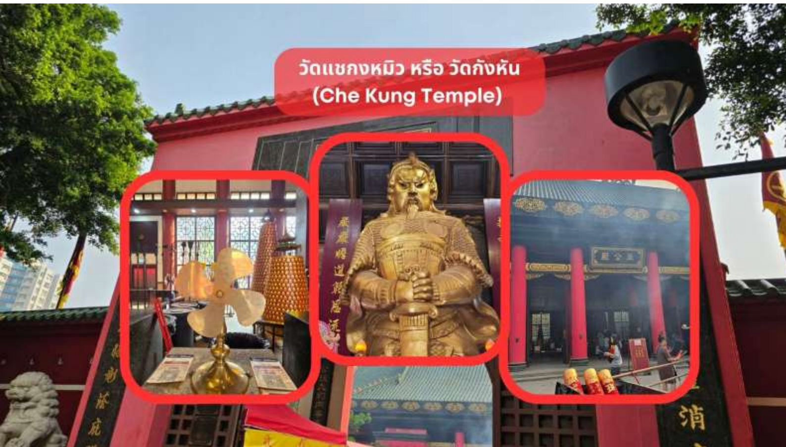
วัดแขกหมิว หรือ วัดกัณฑ์ (Che Kung Temple)

จากนั้นนำท่านเดินทางสู่ วัดแขกหมิว หรือ วัดกัณฑ์ (Che Kung Temple) ขอพรเรื่องการเดินทางปลอดภัย สุขภาพแข็งแรง โชคลาภ และเงินทอง วัดตั้งฮ่องกงที่ตั้งมาถึงเมืองไทย เป็นวัดที่มีประวัติศาสตร์ยาวนานกว่า 300 ปี ภายในวัดมีรูปปั้นสีทองเหลืองอร่าม ตั้งตระหง่านทั้งชายและขวา เป็นวัดศักดิ์สิทธิ์ที่มีความเชื่อในเรื่องกัณฑ์ลม โดยความหมายของใบพัดทั้ง 4 คือ เดินทางปลอดภัย อายุยืนยาว เงินทองไหลมาเทมา และสมปรารถนาทุกประการ หากหมุนกัณฑ์ตามเข็มนาฬิกา 3 รอบ จะพัดพาเอาสิ่งไม่ดีออกชีวิต และนำสิ่งดี ๆ เข้ามาแทน