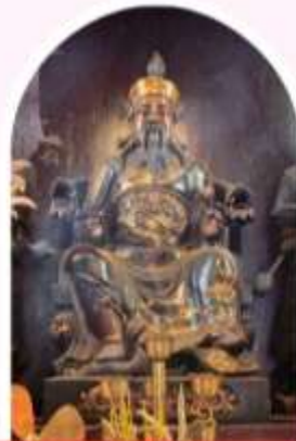
วัดปักโต เสริมโชคกลาง นำพาความรุ่งเรือง