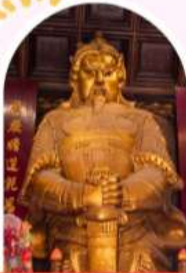
วัดแชกง บอพรโชคกลาง การเงิน และธุรกิจ

"ไหว้พระ เสริมดวง เพิ่มสิริมงคลแก่ชีวิต"