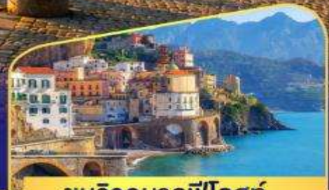
ชมวิวมอลฟีโดสท์