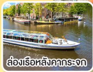
ล่องเรือหลังคากระจก

พิเศษ!! เมนูหอยแมลงภู่อบไวน์ขาว ล่องเรือหมู่บ้านไรกันน ที่รูน