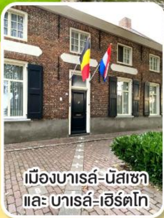
เมืองบารส์-นัสซา และ บารส์-เฮิร์ตโก