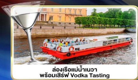
ส่งเรือแม่น้ำวอวา พร้อมลิ้มรส Vodka Tasting

📅 เดินทาง : 14-21 มิ.ย.69 / 28 มิ.ย.-05 ก.ค.69 / 24-31 ก.ค.69