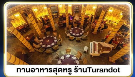
ทานอาหารสุดหรู ภัตตาคารTurandot