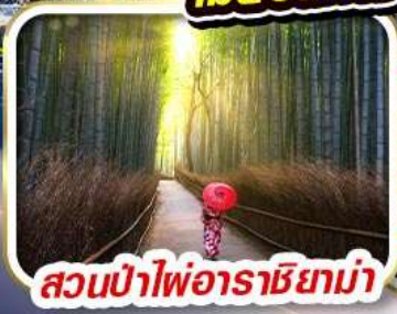
สวนป่าไฟอาราชิยาม่า

อิสระเต็มวัน เลือกซื้อแพ็คเกจ! - UNIVERSAL STUDIO JAPAN