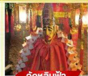
วัตหลินฟ้า