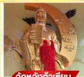
วัตหวังต้าเซียม