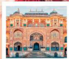
♥♥♥ Amber Fort