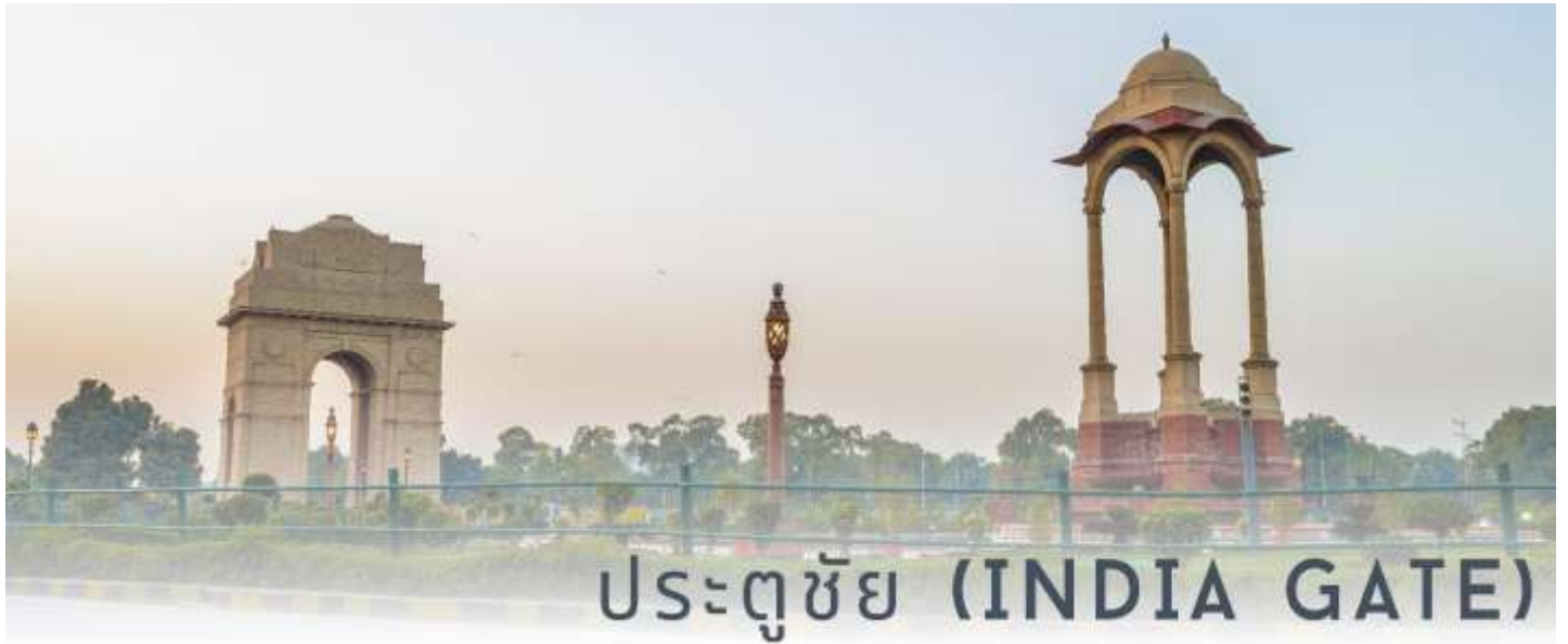
ประตูละคร (INDIA GATE)

สายนี้ตั้งอยู่บริเวณใจกลางเมืองเดลี ทำให้เดินทางไปมาได้สะดวกจากทุกมุมของเมืองหลวงเป็นสถานที่ตั้งของ ธรรมเนียมรัฐบาลของอินเดีย