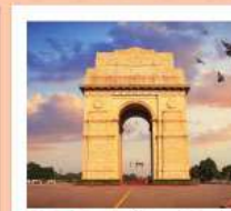
♥♥♥ India Gate