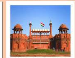
♥♥♥ Agra Fort