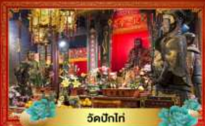
วัดปึกโท