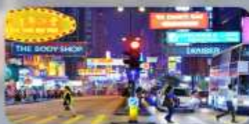
จิมซาจู้