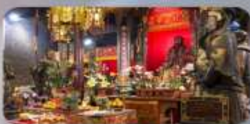
วัดบิกโท