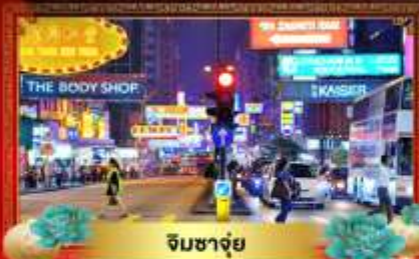
จิมซาจ๋ย