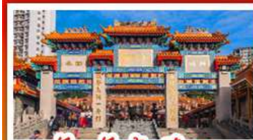
วัดเขว้งต้าเซียน

วัดเจ้าแม่กวนอิมฮ่องฮำ - กระเช้าองปิง พระใหญ่ไถ่หลิน - เจ้าแม่กวนอิมรัฟลส์เบย์ วัดเขกงหมิว - วัดหวังต้าเซียน - วัดเจ้าแม่ทับทิม