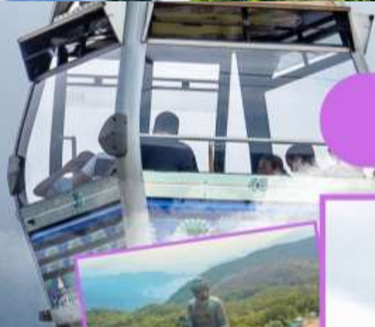
พระใหญ่ล้านเตา นั่งกระเช้ามองปิ๊ง 360