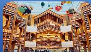
ห้องสมุดสตาร์ฟิค