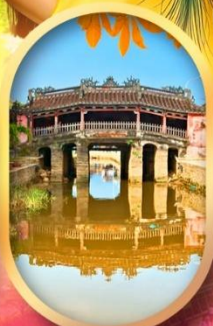
เมืองเก่าฮอยอัน