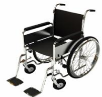
การรับการดูแลเป็นพิเศษ

กรณีผู้เดินทางต้องการความช่วยเหลือเป็นพิเศษ อาทิเช่น การใช้วีลแชร์ กรุณาแจ้งบริษัทฯ อย่างน้อย 7 วันก่อนการเดินทาง มิฉะนั้นบริษัทฯ จะไม่สามารถจัดการล่วงหน้าได้ เนื่องจากการขอใช้วีลแชร์ในสนาม บินนั้น ต้องมีขั้นตอนในการขอล่วงหน้า และบางสายการบินอาจมีการเรียกเก็บค่าใช้จ่ายทั้งทางสนามบิน ในไทยและในต่างประเทศ ซึ่งผู้เดินทางสามารถสอบถามกับเจ้าหน้าที่ได้โดยตรงก่อนทำการจอง และหาก ในคณะของท่านมีผู้ต้องการดูแลพิเศษ เช่น ผู้ที่นั่งรถเข็น (Wheelchair), เด็ก, ผู้สูงอายุและผู้ที่มีโรค ประจำตัวหรือไม่สะดวกในการเดินทางท่องเที่ยวในระยะเวลาเกินกว่า 4 - 5 ชั่วโมงติดต่อกัน ท่านและ ครอบครัวต้องให้การดูแลสมาชิกภายในครอบครัวของท่านเอง เนื่องจากการเดินทางเป็นหมู่คณะ หัวหน้า ทัวร์มีความจำเป็นต้องดูแลคณะทัวร์ทั้งหมด