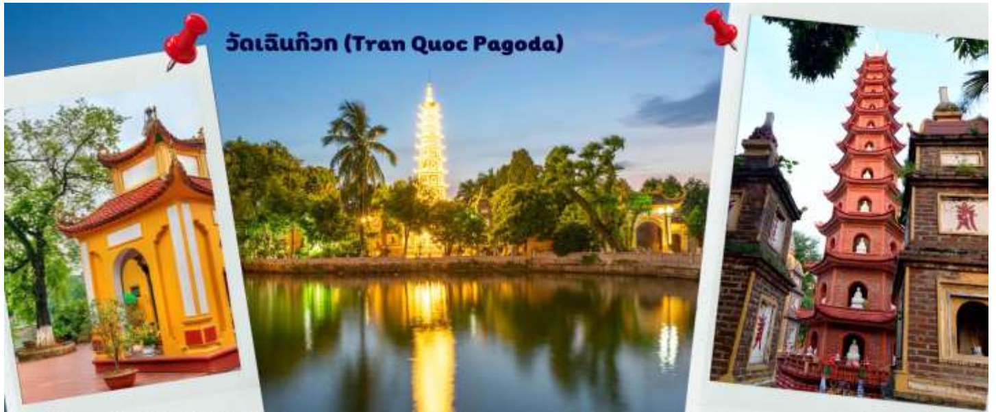
วัดเงินทิว (Tran Quoc Pagoda)

สมควรแก่เวลา นำท่านเดินทาง สู่ท่าอากาศยานนานาชาติฮานอย เตรียมตัวเดินทางสู่กรุงเทพฯ