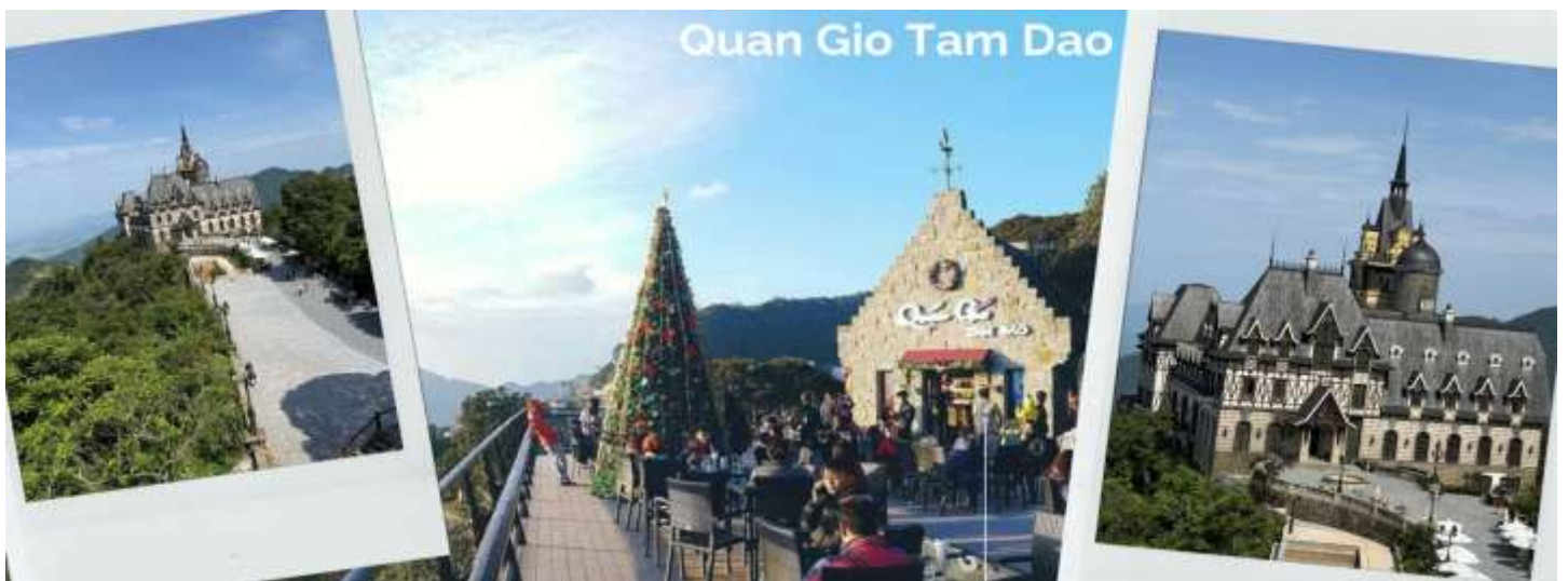
Quan Gio Tam Dao

จากนั้นนำท่านไป คาเฟ่ (Quan Gio Tam Dao) อยู่ที่เมืองตามด้าว ตั้งอยู่บนเนินเขาสูงราว 1,000 เมตรเหนือระดับน้ำทะเล ทำให้ได้สัมผัสสายลมเย็นๆ ได้ทั้งวันเลย คาเฟ่ที่ตั้งอยู่ใกล้กับโบสถ์หิน และจัตุรัสกลางเมืองตามด้าว ซึ่งเป็นแหล่งท่องเที่ยวหลักของเมืองนี้ ที่มีปราสาทตามด้าว เป็นไฮไลท์ของที่นี่เลย ปราสาทสีขาวสุดอลังการที่ตั้งอยู่ท่ามกลางเขา เหมือนกับหลุดออกมาจากเทพนิยายยุโรป ร่วมกับบรรยากาศหมอกบาง ๆ ทำให้มุมนี้กลายเป็นหนึ่งในวิวที่โรแมนติกที่สุดในเมืองของตามด้าว