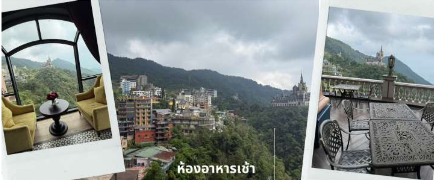
ห้องอาหารเช้า

ให้ท่านได้อิสระถ่ายรูปกับปราสาทตามด้าว ณ ห้องอาหารเช้าโรงแรมที่เราพัก